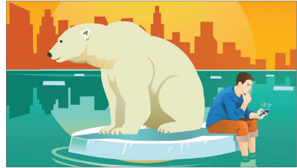
یک پل بزرگ در چین که در آن یک پل بزرگ برای عبور از رودخانه یانگ‌تسه ساخته شده است.

بایفورد سانگ: چین در برابر تغییرات اقلیمی بسیار آسیب‌پذیر است. در تابستان سال گذشته، سیل بزرگی در مرکز چین رخ داد که میلیون‌ها نفر را آواره کرد و قیمت مواد غذایی را افزایش داد. بنابراین با شدیدتر شدن تغییرات آب و هوا، حتما تأثیرهای آن بیشتر می‌شود. مثلا سیلی که آمد در قسمت پایین رودخانه یانگ‌تسه بود که مرکز تولید عمدهٔ مواد غذایی است. بیش از