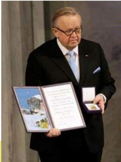
مارتی اھتیساری، رئیس جمهور پیشین فنلند و برنده جایزه صلح نوبل که میانجی‌گر اصلی صلح آچه بود