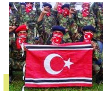
جنبش آچه آزاد (GAM)

تلاش برای گسترش این توافق‌نامه به منظور ایجاد روند گسترده‌تری به هدف حل منازعات، بی‌نتیجه بود؛ چرا که آتش‌بس نقض شد. هنوز ۱۱ روز از امضای موافقت‌نامه صلح میان دولت مرکزی اندونیزیا و جنبش آچه آزاد سپری نشده بود که خبرگزاری‌ها از آغاز درگیری مسلحانه میان دو طرف خبر دادند. سخنگوی ارتش اندونیزیا به رادیوی دولتی جاکارتا گفته بود که چریک‌های جنبش آچه یک موتر نظامی ارتش را منفجر کردند و به سوی سربازان آتش گشودند. مخالفان از یک سو از آتش‌بس برای تقویت موقعیت خود استفاده می‌کردند و دولت اندونیزیا نیز در حالی که جنگ را متوقف نکرده بود، صحبت از صلح می‌کرد. پس از لغو موافقت‌نامه صلح میان جنبش آچه و دولت مرکزی اندونیزیا، جاپان با ایفای نقش میانجی از آنان خواست تا گفت‌وگوهای خود را برای دستیابی به یک راه حل جامع در توکیو ادامه دهند. توکیو وعده داده