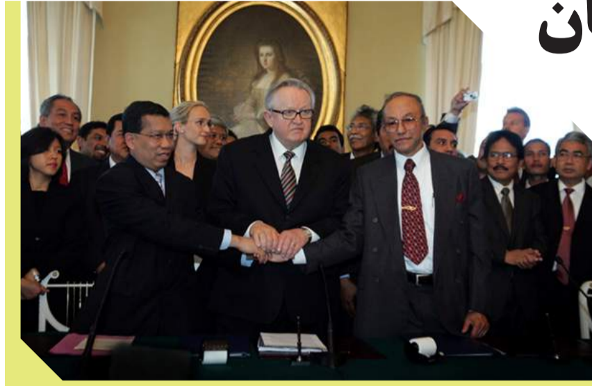
مراسم امضای توافق‌نامه صلح هلسینکی میان دولت اندونیزیا و جنبش آچه آزاد - اگست ۲۰۰۵

جنبش آچه آزاد (جی‌ای‌ام) از سال ۱۹۷۶ میلادی برخاسته از آچه، ولایتی غربی در اندونیزیا، برای استقلال خود در برابر دولت مرکزی در جاکارتا می‌جنگید. سه دهه خشونت و درگیری سبب کشته شدن بیش از ۱۵ هزار نفر و آواره‌گی هزاران تن شد. چهار دوره مذاکره برای پایان خشونت‌ها بی‌نتیجه بود، اما پس از وقوع سونامی در سال ۲۰۰۴ که منجر به کشته شدن ۱۷۰ هزار نفر، بی‌خانمانی حدود ۵۰۰ هزار تن و هم‌چنین وارد شدن خسارت بالغ بر پنج میلیارد دلار در اندونیزیا و به ویژه آچه شد، طرفین درگیری با عزم جدید برای پایان دادن به خصومت‌ها به میز مذاکره بازگشتند.