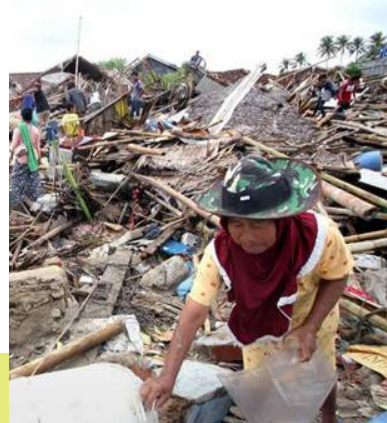
سونامی سال ۲۰۰۴ در آچه اندونیزیا که زمینه‌ساز صلح شد

جدای از آن، سازمان‌های غیردولتی در آچه پیش‌گام برجسته‌سازی بحث‌های اجتماعی در مورد مسایل بشردوستانه و آرایه راهکارهای مسالمت‌آمیز برای ختم جنگ شد. هنگامی که سونامی دسامبر ۲۰۰۴ ساحل آچه را ویران کرد، این کاتالیزور فشار جدیدی برای صلح بود. با ورود به روند مذاکرات بعدی، هر دو طرف انتظارات واقع‌بینانه‌تری از آن‌چه ممکن به دست آورند و شکل اساسی یک توافق، داشتند.