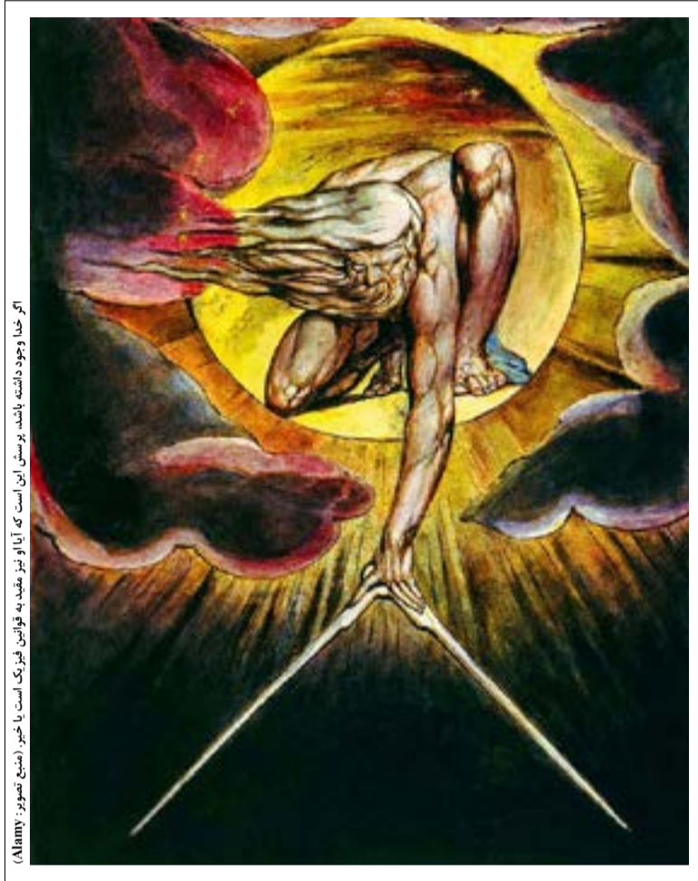
آیا خدا وجود داشته باشد. پرسش این است که آیا او نیز مفید به قوانین فیزیک است یا نه.

است. هرچه زمان می‌گذرد، حجم فضا افزایش می‌یابد و نور برای رسیدن به ما باید مدت زمان بیشتری را خرج کند. عالم هستی بسیار بزرگ‌تر و فراتر از آنچه است که ما می‌توانیم مشاهده کنیم؛ اما دورترین جسمی که تاکنون دیده‌ایم کهکشانی موسوم به GN-z11 است که توسط تلسکوپ فضایی «هابل» مشاهده شده است. این کهکشان حدود 1.2 \times 10^{23} کیلومتر یا 13.4 میلیارد سال نوری از ما فاصله دارد و این یعنی 13.4 میلیارد سال نوری طول کشیده تا نور از این کهکشان به ما برسد. اما وقتی نور «عازم» شد، این کهکشان تنها در حدود سه میلیارد سال نوری از کهکشان راه شیری ما فاصله داشته است.