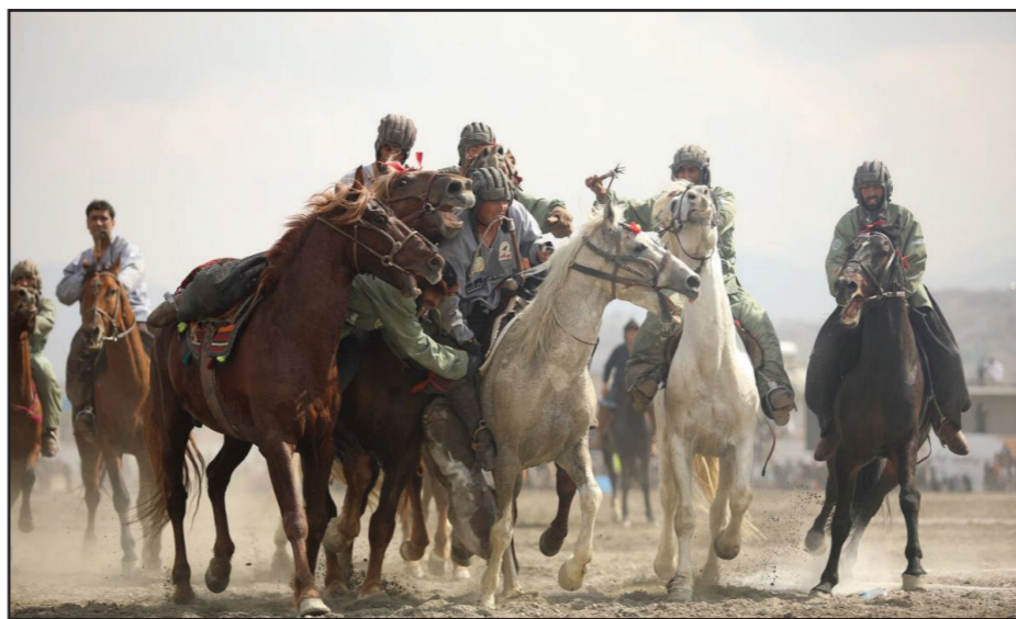
جایگاه سوم این رقابت‌ها را از آن خود کرد. شیوع ویروس کرونا نیمه تمام ماند و جام قهرمانی هم به سال پیش، دوزخست این رقابت‌ها به بد لیل هیچ تیمی داده نشد.

تیم‌های کندهار و کندز در دیدار نهایی دومین لیگ ملی بزکشی در برابر هم تساوی کردند و هر دو تیم به گونه مشترک به‌عنوان قهرمان این پیکارها شناخته شدند. رقابت‌های دومین لیگ ملی بزکشی، روز جمعه هفته گذشته با اشتراک چاپ‌اندازان از چهار زون و ۱۶ ولایت در کابل آغاز شدند و پس از هفت روز پیکار، جمعه ۲۲ حوت به پایان رسیدند. دیدار نهایی این پیکارها برای پنج ساعت و با کشمکش تیم‌های کندهار و کندز با تساوی ادامه یافت اما سرانجام مارشال عبدالرشید دوستم هر دو تیم را با نتیجه تساوی سه - سه، به‌عنوان قهرمان اعلام کرد.