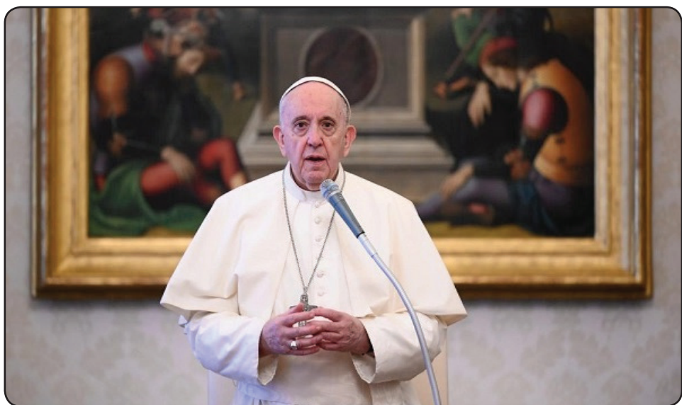
پاپ فرانسیس، رهبر کاتولیک‌های جهان حمله مرگبار به مکتب سیدالشهدا در منطقه دشت برچی از مربوطات ناحیه سیزدهم شهر کابل را محکوم کرده است. او در جریان مراسم مذهبی روز یکشنبه، نهمم ثور برای قربانیان حمله موثر بمب‌گذاری شده به مکتب سیدالشهدا دعا کرده و از دیگران نیز خواسته است که برای آن‌ها دعا کنند. طبق گزارش واتیکان نیوز، پاپ فرانسیس حمله بر مکتب سیدالشهدا را اقدام غیرانسانی خوانده است. او دعا کرده است: «خداوند به افغانستان صلح عطا کند.» حمله مرگبار عصر روز شنبه، هیجدهم ثور که ناشی از انفجارهای سه‌گانه در ورودی مکتب سیدالشهدا در شهر کابل بود، تاکنون واکنش‌های گسترده را در پی داشته است. طبق اعلام وزارت داخله، در این انفجارها دست کم ۵۲ تن کشته و بیش از ۱۵۱ تن دیگر زخمی شده‌اند. آمارهای تلفات این انفجار نیز تاکنون ضدوتقاضی بوده است. وزارت صحت عامه می‌گوید که شمار تلفات ۲۷ کشته و ۸۳ زخمی است. وزارت معارف از کشته شدن ۴۰ تن و زخمی شدن ۱۴۰ تن خبر داده است. مردم محل و خانواده‌های قربانیان مدعی‌اند که بیش از ۱۰۰ تن در انفجارهای روز شنبه کشته شده است.