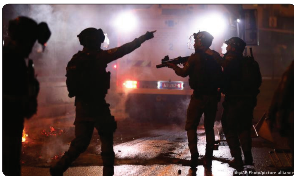
درگیری شدید در اطراف مسجد الاقصی بین معترضان فلسطینی و پولیس اسرائیل دستکم ۹۰ زخمی به جا گذاشت. مأموران به سوی تظاهرکنندگان گاز اشک‌آور، گلوله لاستیکی و نارنجک بی‌حس‌کننده پرتاب کردند. شامگاه شنبه (هشتم می) تنش در اطراف مسجد الاقصی ادامه یافت و پولیس در برابر تظاهرکنندگان

عصر شنبه یک موشک دیگر از نوار غزه به مرز اسرائیل شلیک شد. نیروی هوایی اسرائیل نیز اعلام کرد که در حمله‌ای تازه، یک پست نظامی حماس را منهدم کرده است.