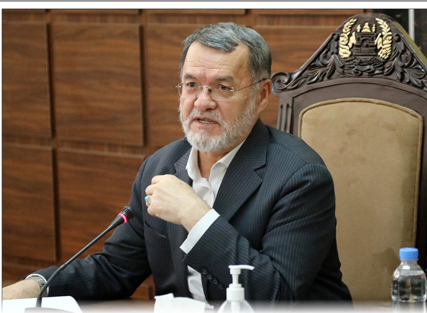
معاون دوم ریاست جمهوری: