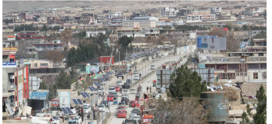
۸ صبح، سمنگان

شماری از فعالان مدنی و اعضای پیشین شورای ملی در شهر ایبک، مرکز سمنگان، از توزیع غیرعادلانه کمک‌های بشر دوستانه به باشندگان این ولایت شکایت دارند. به گفته آنان، جنگ‌جویان طالبان در جریان ثبت خانواده‌های نیازمند عملاً حضور دارند و با اعمال فشار بر کارمندان ساحه‌های نهاد‌های امدادرسان، نام اعضا و بستگان خود را در فهرست جابه‌جا می‌کنند و از نیازمندان «حق» می‌گیرند.