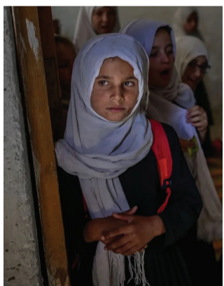
دارند این سیاست را در دانشگاه‌ها نیز اعمال کنند.

۸ صبح، پنجشیر: منابع محلی در ولایت پنجشیر از انفجار یک حلقه ماین کنار جاده‌ای در این ولایت خبر می‌دهند. منابع در صحبت با روزنامه صبح، می‌گویند که این حمله پنج‌شنبه‌شب، ۱۸ قوس، در روستای فرویل، از مربوطات مرکز ولایت پنجشیر، به وقوع پیوسته است. در پی این رویداد، طالبان باشندگان محل را به‌گونه جبری به مسجدی در این روستا گرد آورده و به آنان دستور داده‌اند که عامل این انفجار را پیدا کنند. منابع می‌افزایند که فشار طالبان برای گرفتن اعتراف اجباری مردم نتیجه نداده و اعضای این گروه تمام خانه‌ها را بازرسی و با مردم محل بدرفتاری کرده‌اند. تا کنون از تلفات احتمالی برخاسته از این انفجار، جزئیاتی در دست نیست. پیش از این بارها گروه طالبان باشندگان پنجشیر را به بهانه‌های مختلف بازداشت، شکنجه و در مواردی تیرباران کرده‌اند.