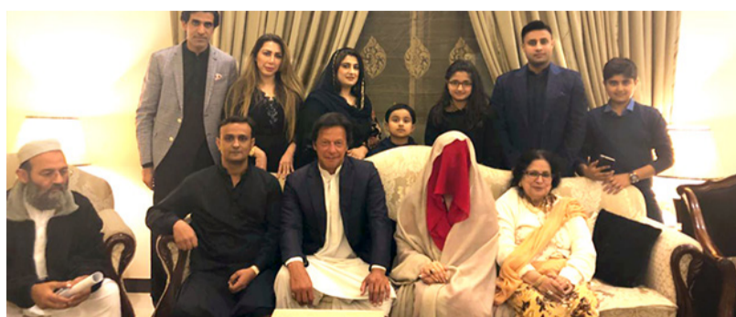
عمران خان که زمانی با یک خانم انگلیسی ازدواج کرده بود و به رفتار و روابط لیبرالیستی مشهور بود، در سال ۲۰۱۸ با خانم بشرای بی‌بی که محجبه است ازدواج کرد و ادعا نمود که قبل از ازدواج نزد آن خانم آموزش تصوف می‌دیده است.

عکس‌هایی که از آن دوره عمران خان به یادگار مانده است، او را میان زنان و مردان شهری و دارای فرهنگ لیبرالیستی نشان می‌دهد؛ اما این وضعیت در دو دهه اخیر تغییر کرده است. عمران خان با وارد شدن به عرصه سیاست، بی‌آن که روابط و محیط شخصی لیبرالیستی‌اش را ترک کند، نقاب سیاسی تازه‌ای پوشیده که از او تمجیدگر طالبان و متحد گروه‌های محافظه‌کار ساخته است.