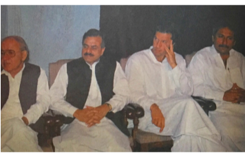
عمران خان سفر سیاسی‌اش را در سال ۱۹۹۴ از گروه سیاسی تازه‌تاسیس جنرال حمیدگل، رییس سابق آی‌اس‌آی، آغاز کرد.

آیا گروه‌زنان خواهند توانست این گره پیچیده را بکشایند؟