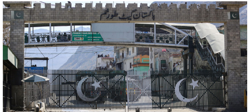
کعبه امین کاوه

وزارت خارجه طالبان با نشر بیانیه‌ای خبری، مرزبانان پاکستانی را عامل درگیری نظامی خوانده است. در بیانیه این گروه آمده است: «نیروهای پاکستانی زمانی بالای نیروهای سرحدی طالبان شلیک کردند که آن‌ها مصروف ترمیم یک پسته امنیتی بودند که سال‌ها قبل اعمار گردیده بود.»