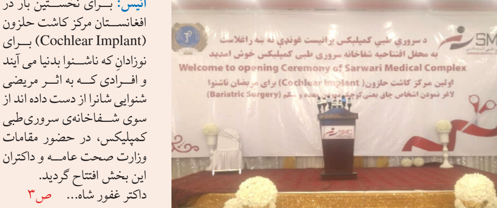
د سروري طبي کمپلکس برائيت غونډي له ننه راغلاستو به محل افتتاحیه شفاخانه سروري طبي کمپلکس خوش آمدید Welcome to opening Ceremony of Sarwari Medical Complex اولین مرکز کاشت حلزون (Cochlear Implant) برای بریض ناشنوا لافر نمودن اشخاص جای بعضی کوژیونو پون وندو و ګم (Bariatric Surgery)

د افغانستان د اوسپني پتلي ادارې ويلي؛ تېره اوونۍ کې د اوسپني پتلي له لارې ۷۳ زره ۶۸۵ متریک ټنه انتقالات شوي دي. يادې ادارې زیاته کړې؛ چې د حیرتان بندر له لارې ۶۰ زره ۳۹۰ ټنه، د اقبني بندر له لارې ۳۹۰ ټنه او د تورغوندي بندر له لارې شپږ زره او ۶۱۰ ټنه انتقالات شوي چې ټول ۷۳ زره ۶۸۵ ټنه نغتي، غیر نغتي او نور مواد وارد او صادر شوي دي. د افغانستان د اوسپني پتلي ادارې ويلي؛ تېره اوونۍ کې د اوسپني پتلي له لارې ۷۳ زره ۶۸۵ متریک ټنه انتقالات شوي دي. يادې ادارې زیاته کړې؛ چې د حیرتان بندر له لارې ۶۰ زره ۳۹۰ ټنه، د اقبني بندر له لارې ۳۹۰ ټنه او د تورغوندي بندر له لارې شپږ زره او ۶۱۰ ټنه انتقالات شوي چې ټول ۷۳ زره ۶۸۵ ټنه نغتي، غیر نغتي او نور مواد وارد او صادر شوي دي.